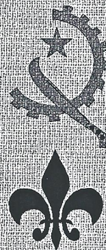
Ejemplo de insignias usadas en banderas o banderines.